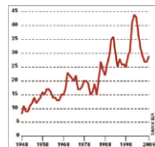
Part des profits du secteur financier dans l'ensemble des profits des entreprises domestiques américaines, en%

A un troisième niveau, la finance organise à son profit un scandaleux détournement de fonds et de talents. Depuis le début des années 1980, les profits du secteur financier ne cessent de gonfler par rapport à ceux du reste de l'économie (voir graphique). Une telle rente ne peut qu'accroître les inégalités de revenus déjà criantes entre le secteur financier et le reste de l'économie.