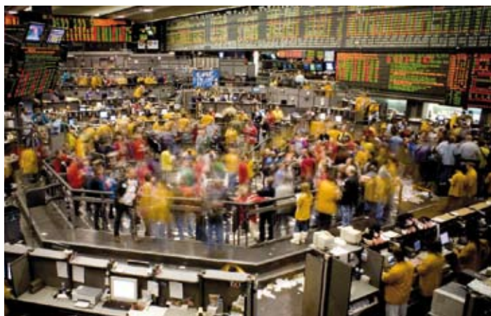
La Bourse de Chicago. L'instabilité financière s'est encore aggravée depuis l'éclatement de la crise en 2008.

Il y a cependant quelques raisons d'espérer, notamment suite à l'adoption par le Congrès le 21 juillet dernier de la plus vaste réforme de la régulation du système financier américain depuis les années 30, réforme qui a entre autres pour objet de protéger les fonds publics. Espérons que nos dirigeants européens s'inspirent de cette réforme pour remettre la finance au service des besoins humains ! (jsz)